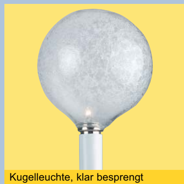
Kugelleuchte, klar besprenget