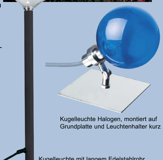
Kugelleuchte Halogen, montiert auf Grundplatte und Leuchtenhalter kurz